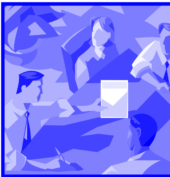
figure professionali, quali il personale ATA il quale svolge mansioni impiegate non affiancabili all'insegnamento;

Vorremmo infatti che i colleghi riflettessero sull'importanza di far parte e sostenere un'organizzazione di soli insegnanti, che conoscono sul campo la realtà, un'organizzazione che esclude la controparte: i dirigenti e che chiede una differenziazione dalle altre